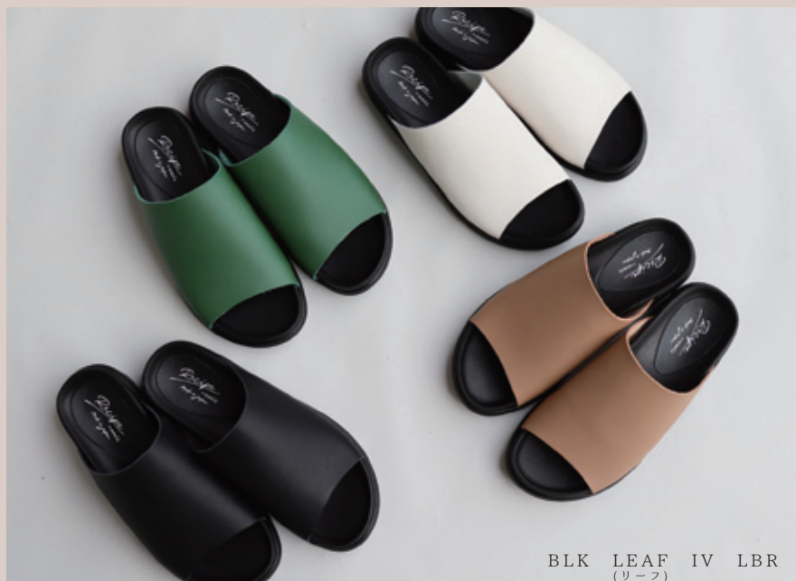
BLK LEAF IV LBR (リーフ)