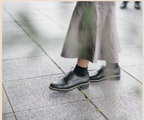
RP-308 BLK (18 ページ)

柔らかくて足にフィットする レシピの靴は、ショッピング などの長時間の街歩きでもス トレスフリー。 特にひも靴は、ご自身の足の 甲に合わせて調節できるので おすすめです。