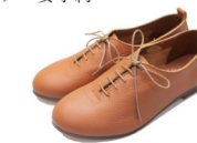
レースアップシューズ