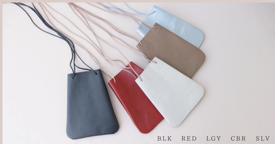
BLK RED LGY CBR SLV