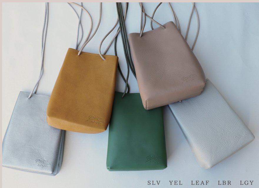
SLV YEL LEAF LBR LGY